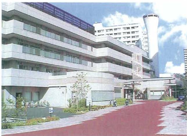
北区立高齢者在宅サービスセンター桐ヶ丘やまぶき荘 桐ヶ丘やまぶき荘 高齢者あんしんセンター（地域包括支援センター） 居宅介護支援事業所桐ヶ丘やまぶき荘

1F ■1F施設 喫茶コーナー「やまぶき」/食堂・テイルーム/高齢者デイホーム/ 機能回復訓練室/一般浴室/機械浴室/福祉機器展示コーナー/ 介護者教室