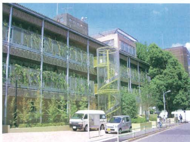
港区立高齢者在宅サービスセンターサン・サン赤坂

〒115-0054 東京都北区桐ヶ丘1-16-26 ●JR「北赤羽駅」赤羽口改札から、徒歩13分 ●JR「赤羽駅」下車 北改札西口から国際興業バス・ときわ台駅行・蓮根循環・王子駅行「赤羽郷」バス停下車 徒歩約5分 TEL: 03-5924-0150 【電話受付時間】月曜～金曜 9:00～17:45 yamabuki@seirouin.or.jp