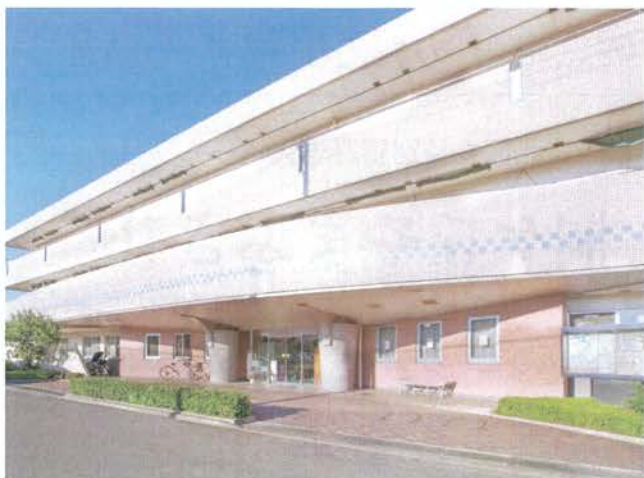
高齢者在宅サービスセンター清雅 きよせ清雅地域包括支援センター