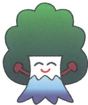
東京聖労院イメージキャラクター 「元気くん」