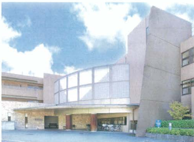
中町高齢者在宅サービスセンター 中町ヘルパーステーション 小金井ひがし地域包括支援センター 居宅介護支援事業所つきみの園

〒204-0003 東京都清瀬市中里 5-91-2 西武池袋線「清瀬駅」下車北口より西武バス ●旭が丘団地行(けやき通り経由) ＜下清戸二丁目＞バス停下車徒歩5分 ●志木駅南口行<台田>バス停下車 徒歩5分 TEL:042-493-0120 【電話受付時間】月曜～土曜 9:00～17:45 seiga-soumu@seirouin.or.jp